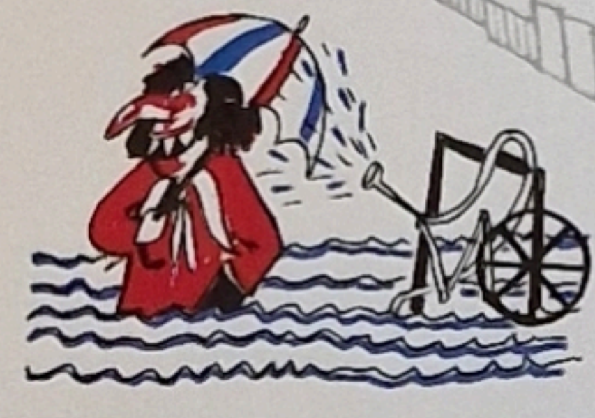
7 Am Fasnachtsbrunne halte mer aa, ass dr Birsig nomool dusche kaa. (Aimool ussetze)