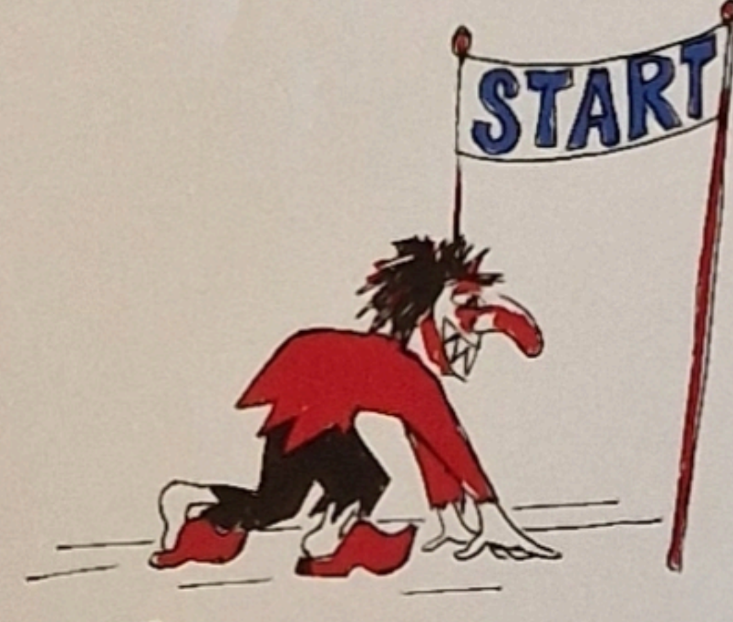
1 Mit emen Ainser goots fir Di loos, nummen esoo kasch uff d Fasnachtsstrooss.