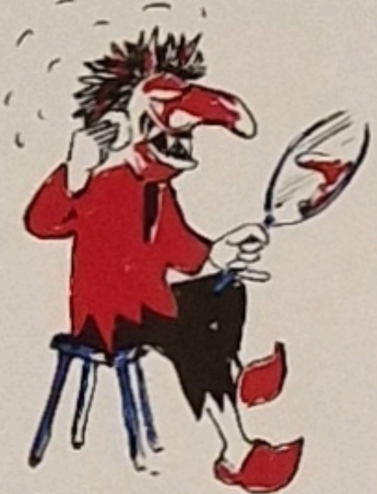
104 Hesch Kerper, Gsicht und d Fiess loo pfliäge, bisch sicher e Rundi bim Giselle glääge. (Aimool ussetze)