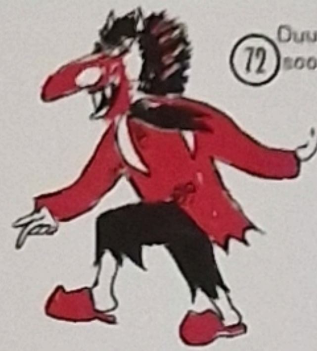
72 Duur s Comité zem zwäite Mool, soo wirfle denn graad nonemool.