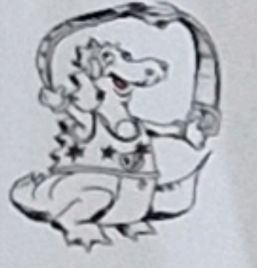
29 Ändlig hetts glabbt, bisch duure koo, Duu kasch daas Wunder kuum verstoo; hesch wirgglig gwunne, s isch kai Spass, hool drumm Dy Swotsch an dr Rittergass. (zwaaimool ussetze)