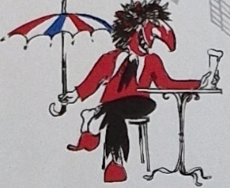
17 Bim Bistro kasch nit dusse hogge, wirfle nomool und abb uff d Sogge.