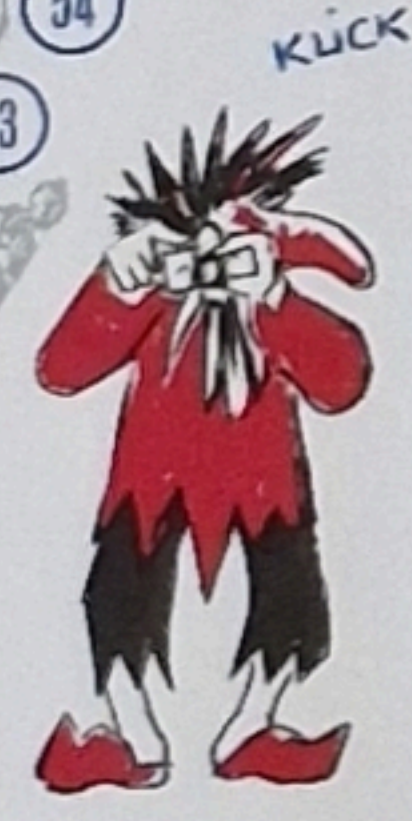
Doo stoot dr Bobby am Stroosserand mit em Fottiapparat in dr Hand. Jetz hesch Bäch, denn jetz blybsch sto und losch uns alli duure goo.