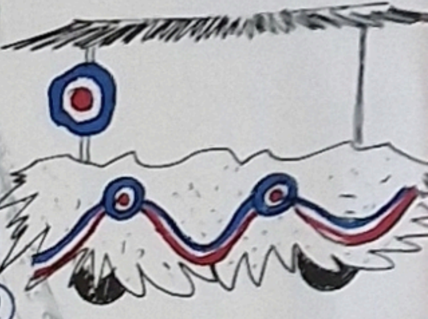
59 Woo kunnt denn acht au dää Namme haär, dr Waage isch syt Stunde läär. D Pausewaggis hänn e Wuntsch, e Dreier, ass de wytter kunnsch.