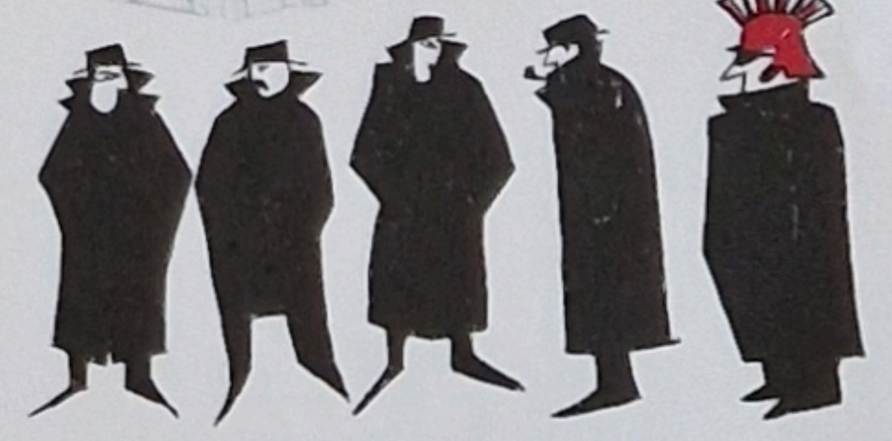
35 Doo waisch joo, ass de nit derfch halte, bim Comité, dääne dunggle Gstatte. (Fimf Fälder voorwärts)