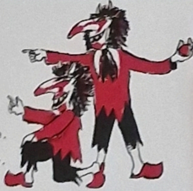
67 Vo doo diräggst an Claraboschte, dert sait dr Dölf, waas dass duet koschte. Daas Spiil goot klaar fir Di in d Hose, drumm haus in d Baiz jetz ain goo bloose.