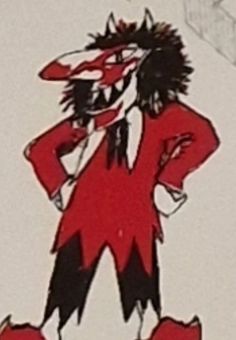
98 Doo wirts dr haiss, doo wirts dr kalt, Duu machsch jetz doo zwai Runde halt; im erschte Stogg in dr Singerhitte gseesch zwai Waggis ain hindere schitte.